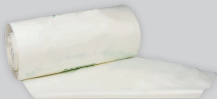
Maisstärkebeutel 35 l