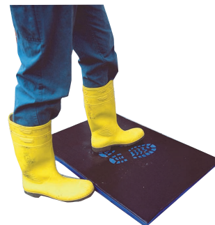
Desinfektionsmatte 60 x 90 cm