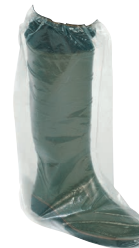
Überschuhe mit Gummizug

Größe: S - XL / 1 Packung: 100 Stk 20352-00-##