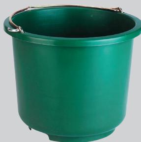
Stalleimer 12 l