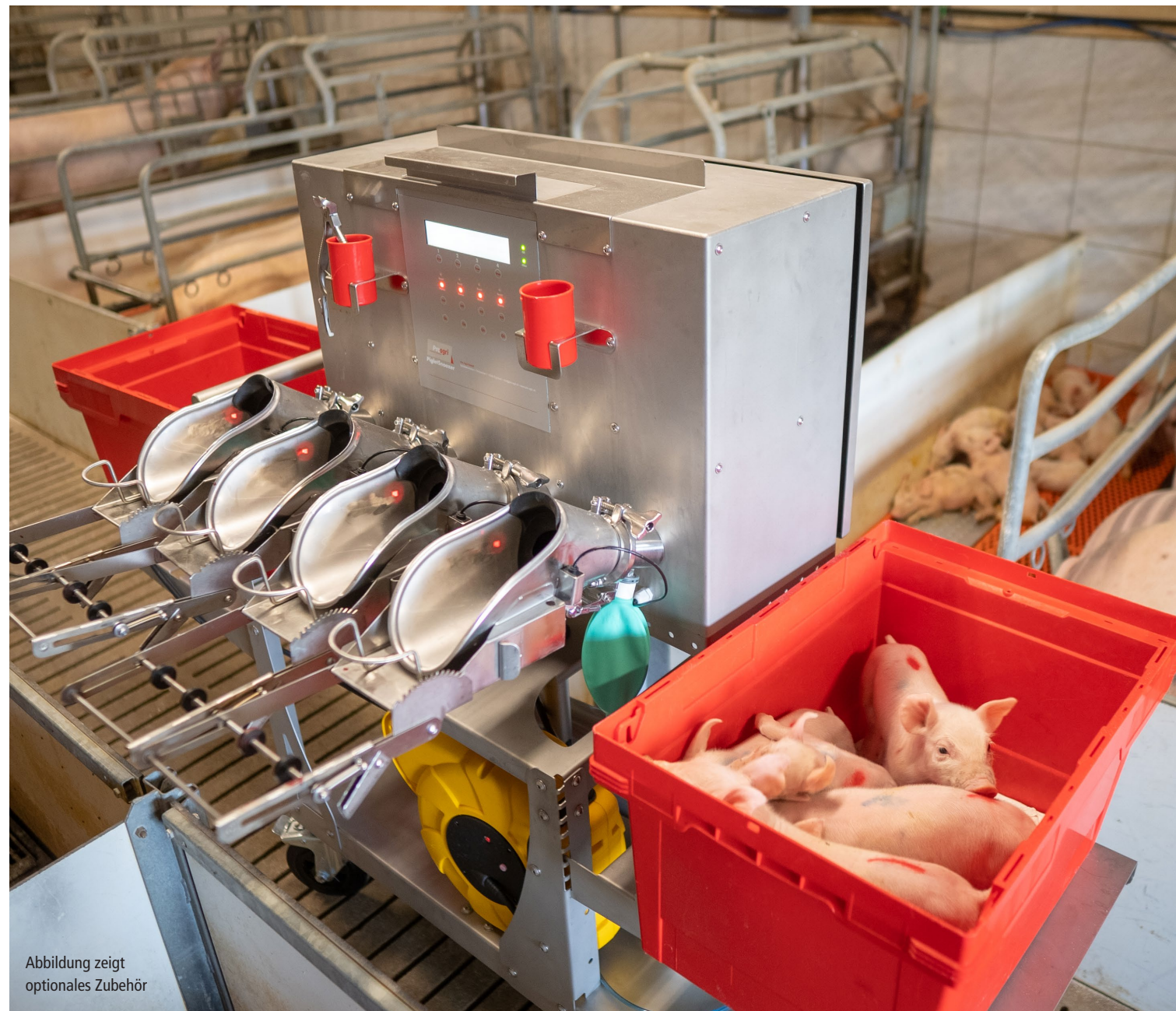
Abbildung zeigt optionales Zubehör

➔ höhenverstellbare 180° drehbare Snooze-Station